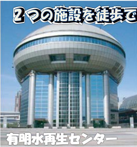
有明水再生センター