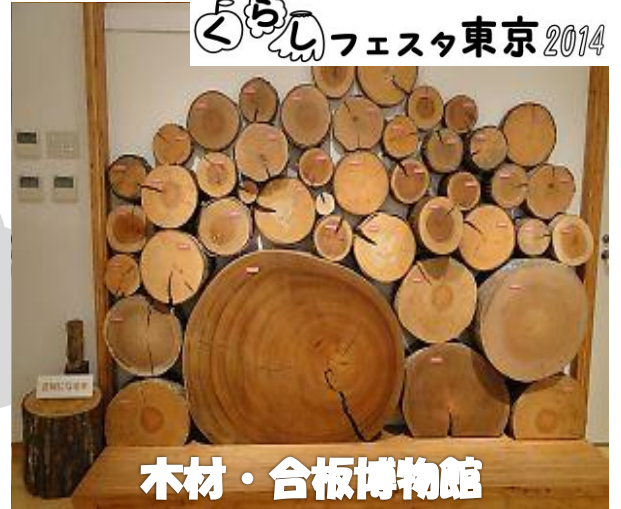
木材・合板博物館